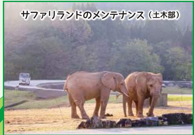
サファリランドのメンテナンス (土木部)