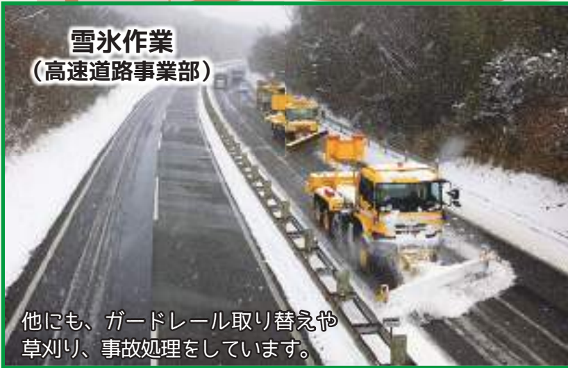
雪氷作業 (高速道路事業部)