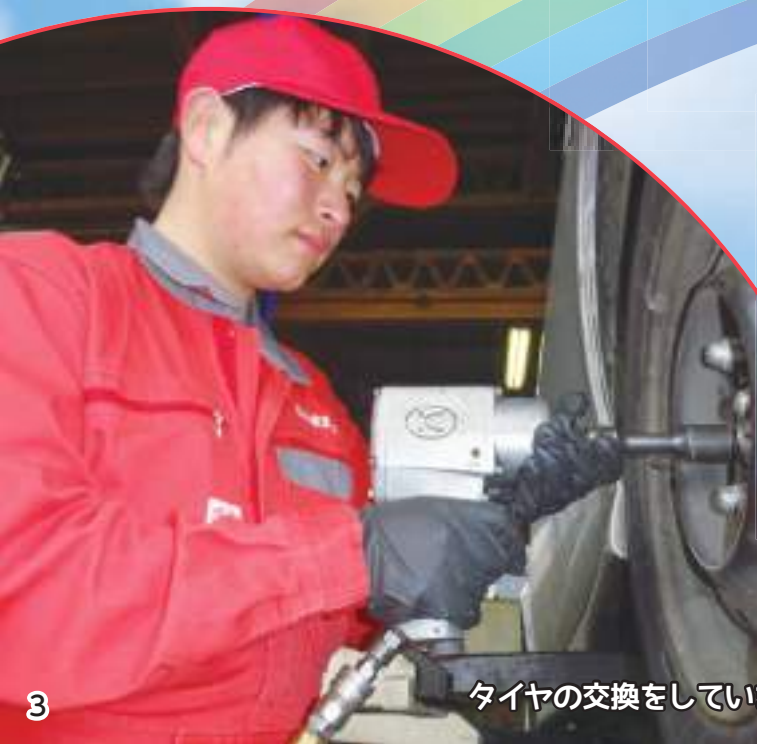
タイヤの交換をしています！