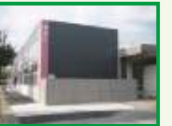
山口大学食堂 新築 (建築部)