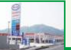
ESSO セルフ山口店 新設 (建設部)