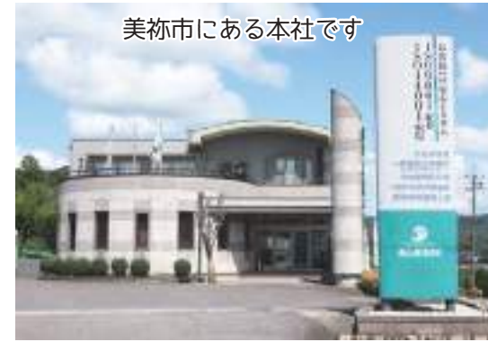
美祢市にある本社です