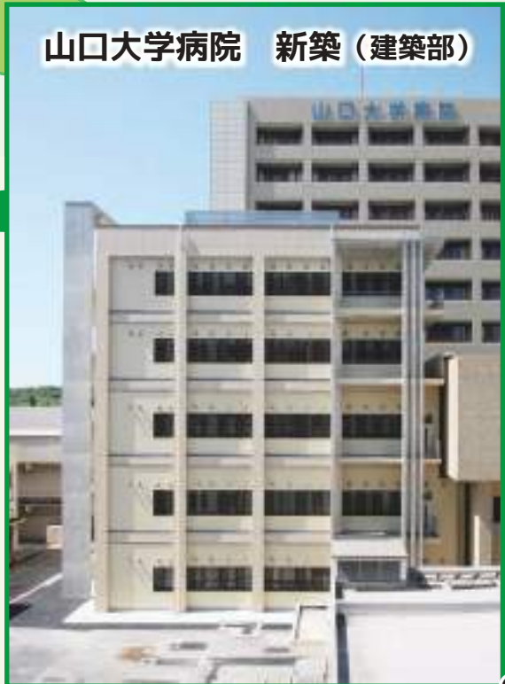
山口大学病院 新築 (建築部)