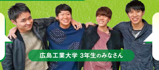
広島工業大学 3年生のみなさん

僕達の中で「社長とは厳格で、雲の上の存在」というイメージでした。でも栗屋社長はとても気さくで、いつでも笑顔で接してくれ、社長をとて身近に感じることができました!