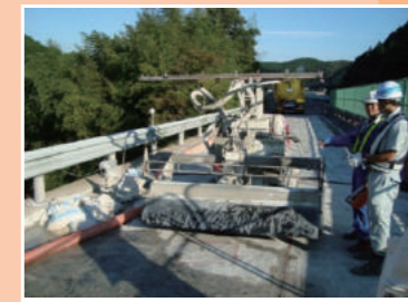
橋梁部の床版はつり