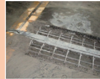
伸縮装置交換時はつり

鉄筋コンクリートは経年劣化により、ひび割れ・中性化が起こることがあります。それにより、鉄筋の強度が不足し倒壊の可能性もでてきます。よって、その前に調査を行い、劣化部を除去し(はつり)、補修することでその建造物の延命化を行っています。