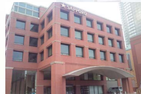
建物総合改修 ビル・病院・施設・学校