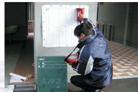
土木構造物補修補強 橋梁・橋脚・トンネル・栈橋