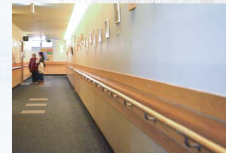
介護改修 水廻り・手摺・バリアフリー