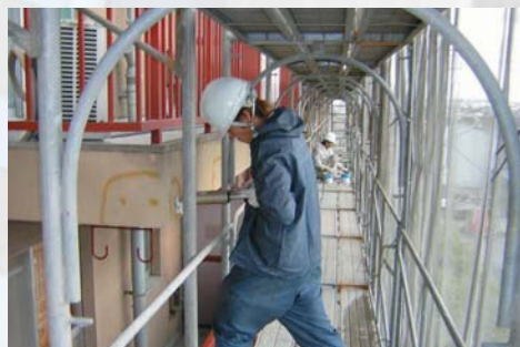
外壁改修 コンクリート・ALC・サイディング