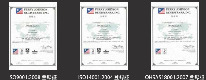
ISO9001:2008 登録証 ISO14001:2004 登録証 OHSAS18001:2007 登録証