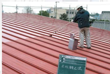
防水・屋根改修 塩ビ・FRP・折板・屋上緑化