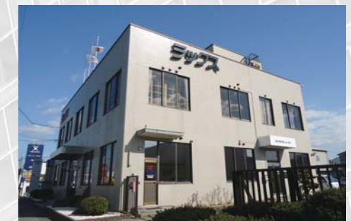
不動産仲介 ビル・マンション・工場・倉庫