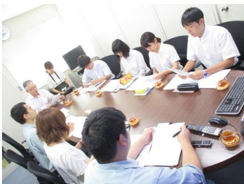
ミーティングの様子