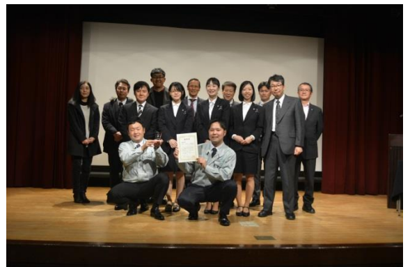
昨年度優秀賞 関西エックス線(株) 安田女子大学・広島経済大学