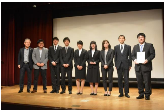
昨年度最優秀賞 東洋電装(株) 広島修道大学・広島工業大学

◇審査ポイント:企業が伝えたいことと学生が知りたいことのギャップをどのように埋めたか。 学生がエントリーしたくなる要素を捉えて、表現できているかなど。